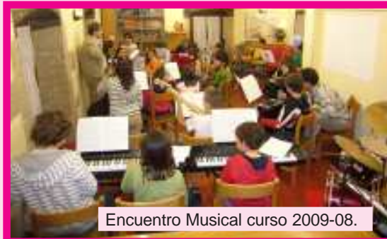
Encuentro Musical curso 2009-08.

¡Ah! nos vamos a alojar en el Albergue Ermita de Carrasquedo de Grañón. Un entorno ideal para compartir la música y hacer amigos.