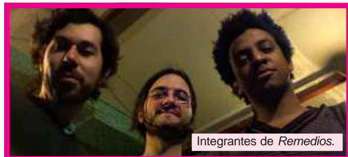
Integrantes de Remedios.