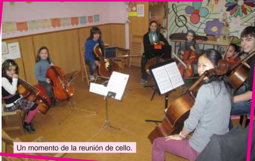
Un momento de la reunión de cello.

En un ambiente lúdico y de compañerismo, los alumnos de cello experimentaron y compartieron las dificultades y también satisfacciones de su instrumento. Como prueba de ello se improvisó una pequeña audición en el Salón de Actos de la Escuela para los padres y familiares que acudieron.