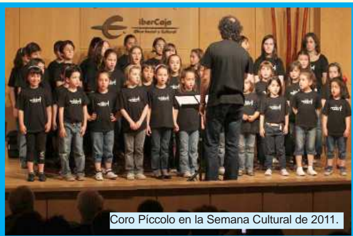
Coro Pícolo en la Semana Cultural de 2011.

Los Coros Infantiles de la Escuela nos proponen a todos UN RETO . Quieren que les ayudemos a buscar un nombre para su formación, y para ello nos retan a todos los que pertenecemos a la Escuela a inventar un nombre para ellos. Nos quieren hacer partícipes de su idea, y para ello han montado en el tablón del pasillo de Pícolo un panel con papeles de colores donde puedes poner el nombre que se te ocurra.