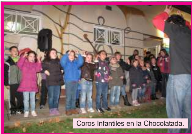
Coros Infantiles en la Chocolatada.

¡Menudo fin de trimestre que hemos tenido! Audiciones, conciertos, festivales, concursos, chocolatada, combos... todos nos hemos merecido unas buenas vacaciones ¿no os parece?