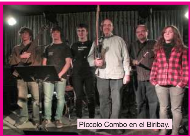
Pícolo Combo en el Biribay.

Comenzamos diciembre con la participación de varios alumnos de acordeón de la Escuela, en el Festival de Acordeón de Mondragón en Guipúzcoa. En la Sala Biribay Jazz Club de Logroño la música moderna y melódica tuvo su hueco. Bandaluse Big Band y varios combos de Pícolo con la participación de alumnos de canto moderno nos deleitaron con estilos como el blues, rock, bossa nova o boleros.