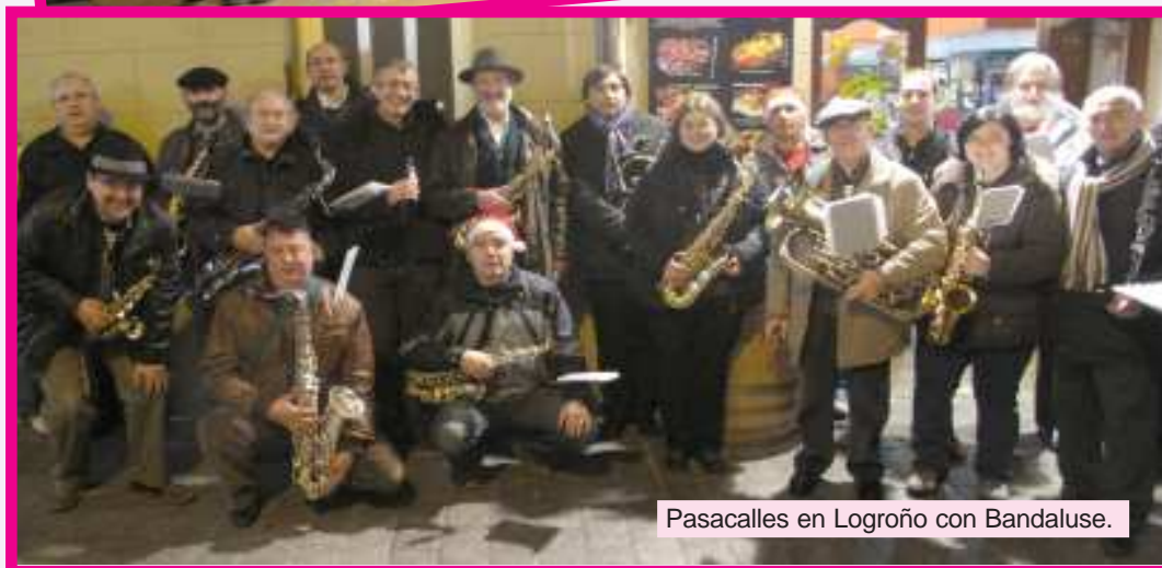
Pasacalles en Logroño con Bandaluse.