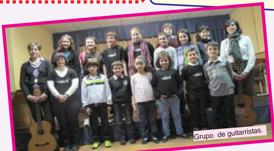
Grupo de guitarristas.

El horario es los viernes de 19;15 a 20;15 horas, si estás interesado apúntate en la oficina. ¡Anímate y prueba!!