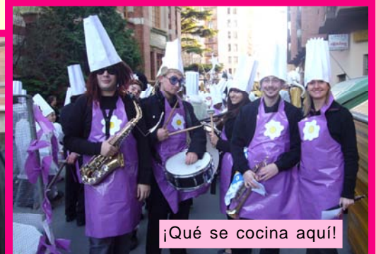
¡Qué se cocina aquí!