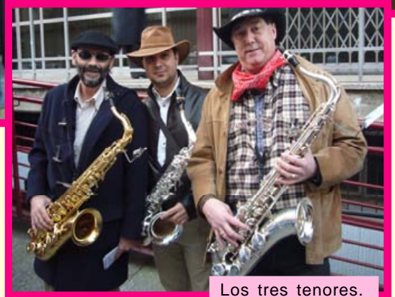
Los tres tenores.

Llegó Carnaval y Pícolo y Saxo acudió para acompañar a las comparsas que desfilaron el pasado sábado 21 de febrero por las calles de Logroño.