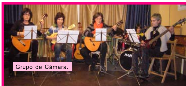
Grupo de Cámara.