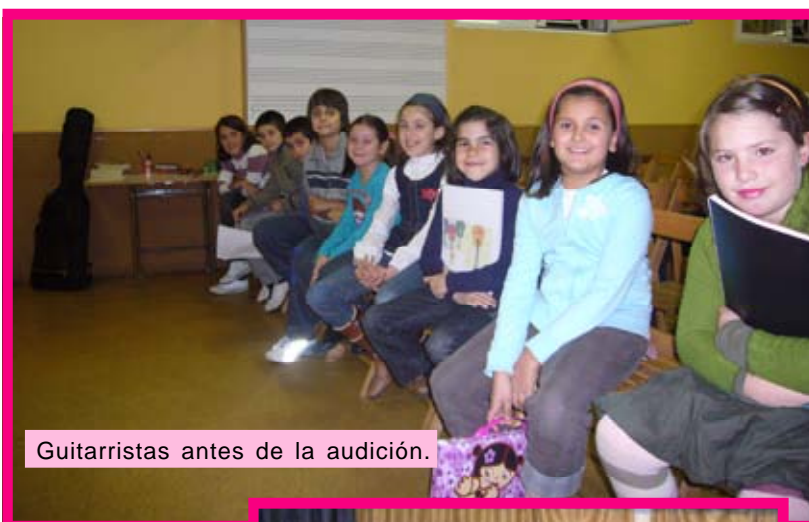
Guitarristas antes de la audición.