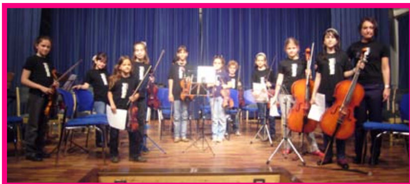
Colectiva de Cuerda en concierto.

importancia de atender las indicaciones del director. Este es el «precio» para poder llegar a un nivel técnico necesario e incorporarse a la Orquesta Sinfónica, la de los mayores. Sin embargo, todo no va a ser