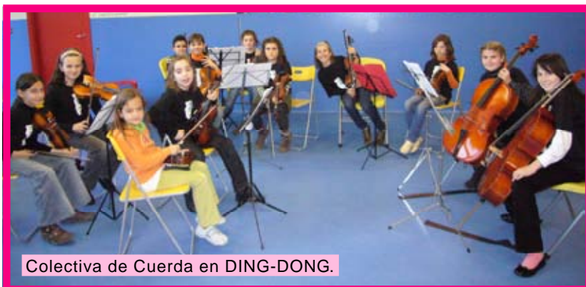
Colectiva de Cuerda en DING-DONG.