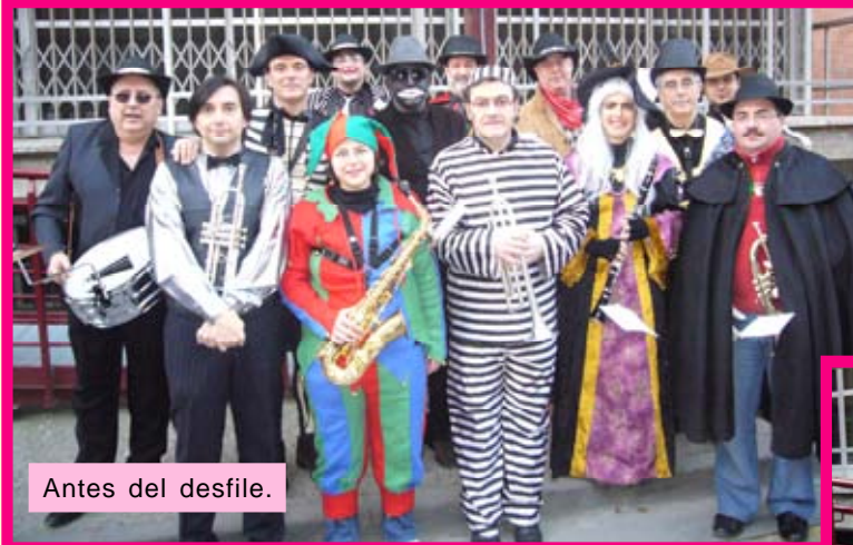
Antes del desfile.