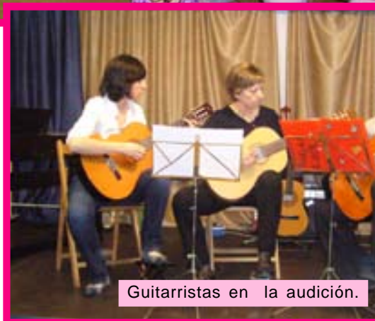
Guitarristas en la audición.

Gracias a todos por vuestra participación tanto a padres como alumnos, y felicitaros por el trabajo realizado.