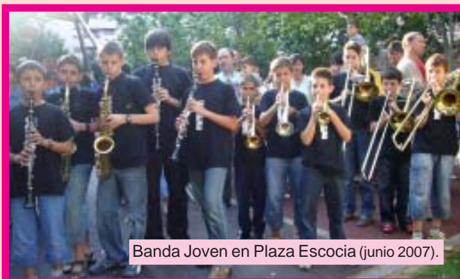
Banda Joven en Plaza Escocia (junio 2007).

¡Pasar un buen verano y hasta el próximo curso!