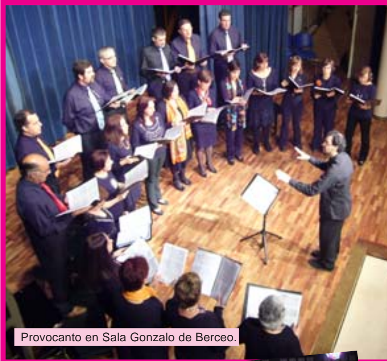
Provocanto en Sala Gonzalo de Berceo.