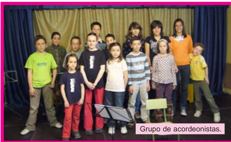
Grupo de acordeonistas.