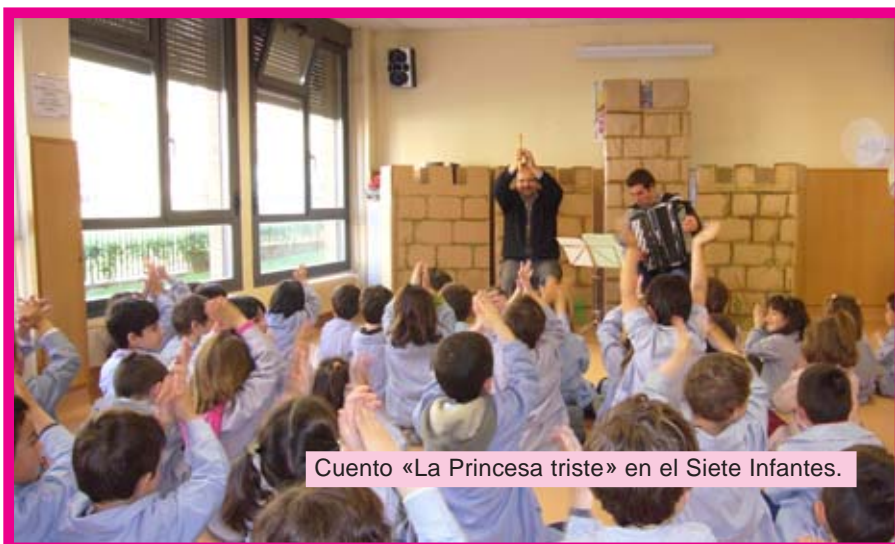
Cuento «La Princesa triste» en el Siete Infantes.

El programa ha contado con diversas actividades como; juegos medievales, torneos, exposiciones, talleres, cuentacuentos... y como en anteriores ediciones Pícolo y Saxo también ha colaborado. El lunes 21 de abril nos visitaron los alumnos de 1º y 2º de Primaria, y les recibimos con un mini-concierto a cargo de profesores y alumnos del Siete Infantes que vienen a clase a nuestra Escuela. Al día siguiente, martes 22 de abril, nos desplazamos al colegio para