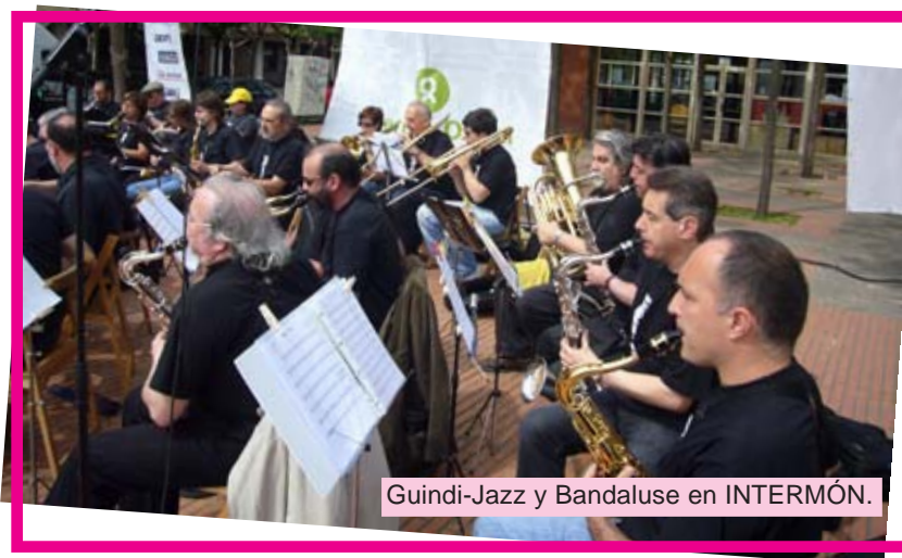
Guindi-Jazz y Bandaluse en INTERMÓN.

Si quieres ver más fotos de nuestro paso por INTERMON y Trevijano, entra en www.piccolosaxo.com