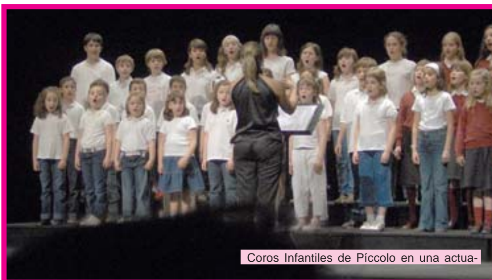
Coros Infantiles de Píccolo en una actua-

Del 16 al 24 de mayo en diferentes escenarios de Logroño.