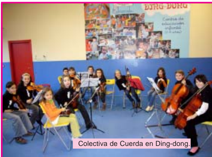
Colectiva de Cuerda en Ding-dong.

Piccolo y Saxo y el Centro de Educación Infantil Ding-Dong colaboran ofreciendo conciertos de diferentes formaciones musicales a lo largo de este curso. El objetivo de este proyecto de colaboración, es dar a conocer la música en directo a los alumnos y familias de Ding-Dong; y a la vez ofrecer un escenario diferente a alumnos de la Escuela