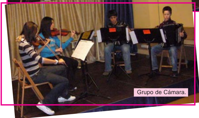
Grupo de Cámara.

Enhorabuena a las dos formaciones por el buen trabajo y esfuerzo.