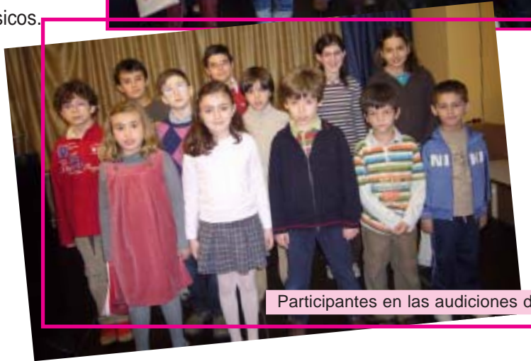
Participantes en las audiciones de Piano.