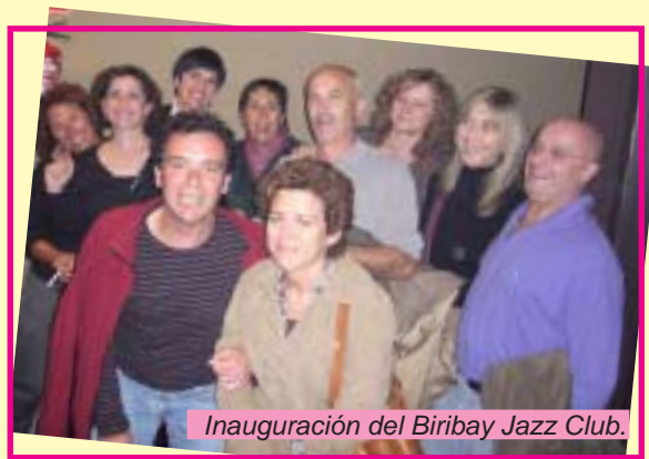
Inauguración del Biribay Jazz Club.