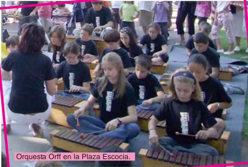
Orquesta Orff en la Plaza Escocia.

El pensamiento orffiano tiene como finalidad los siguientes objetivos prioritarios: