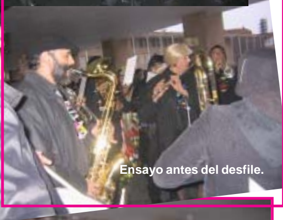
Ensayo antes del desfile.