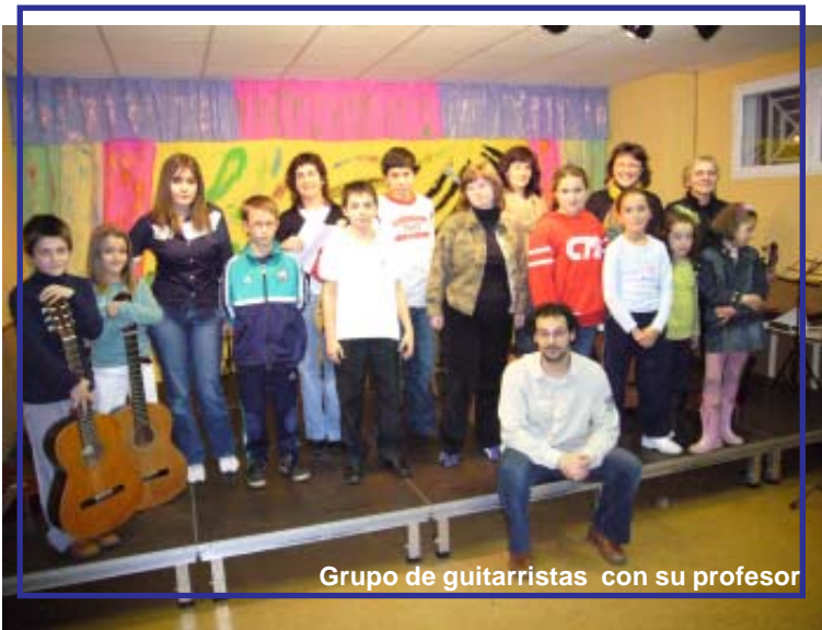
Grupo de guitarristas con su profesor

El viernes 23 de Febrero tuvo lugar en el Salón de Actos de la Escuela, la audición de guitarra en la que participaron 20 alumnos/as. El repertorio fue muy variado: música popular, cánones, temas de The Beatles, música de películas, etc, destacando varios temas propios que compusieron e interpretaron tres jóvenes guitarristas.