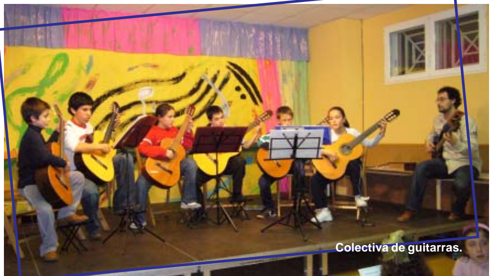
Colectiva de guitarras.

Damos las gracias a los padres y al público en general por sus aplausos y su entusiasmo. Enhorabuena a todos los participantes, que lo hicieron fenomenal!!!!!!.