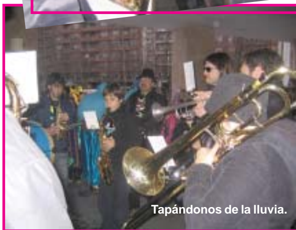
Tapándonos de la lluvia.

Si queréis ver más fotos del desfile de Carnaval podéis entrar en la página www.piccolosaxo.com