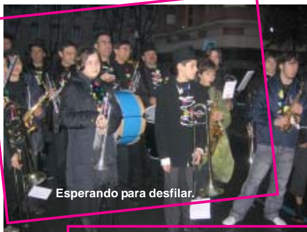
Esperando para desfilir.