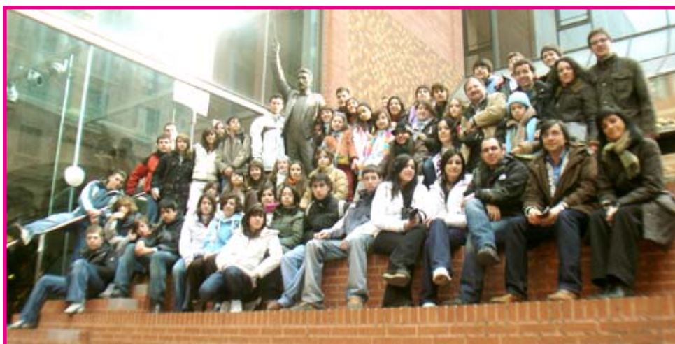
Músicos de la Escuela en el Palau de la Música en Barcelona.

Los profesores de Terrassa tenían mucho interés en conocer nuestra Big Band ya que ellos no cuentan con una sección de música moderna en su Conservatorio. Después de escuchar el concierto nos dijeron que esta misma semana iban a hacer la propuesta de crear una formación de estas características. El día terminó cenando