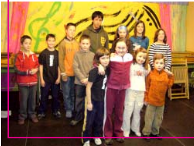
Acordeonistas después de la audición.

El pasado día 19 pudimos disfrutar de una audición de alumnos de acordeón un tanto especial. Ya es conocida la ausencia de estudios reglados de la especialidad de acordeón en el Conservatorio Profesional de Música de Logroño. Debido a esta situación llevamos ya unos años cubriendo, dentro