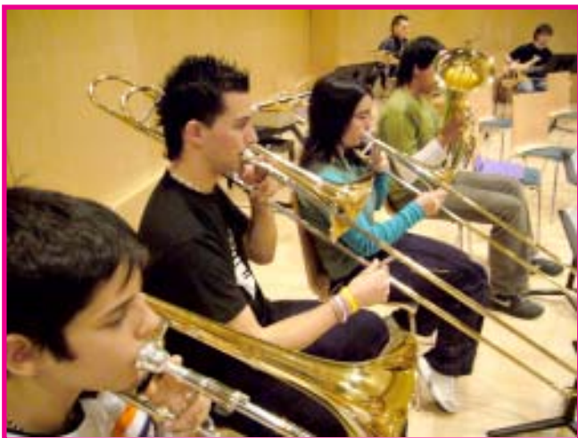
Ensayo en Terrassa.

El título de este artículo lo dice todo. Sólo podemos tener palabras de agradecimiento para todo el colectivo que nos ha recibido en Terrassa: profesorado, alumnado y familias. Estos dos días de estancia han sido un