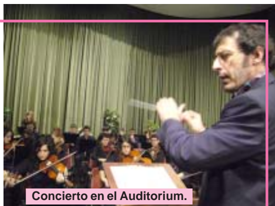
Concierto en el Auditorium.