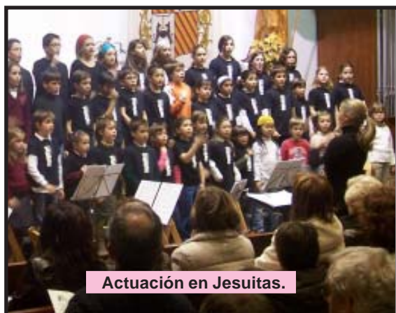
Actuación en Jesuitas.

En Jesuitas ... Fieles a la cita de todos los años diversas formaciones de Pícolo y Saxo participaron, el día 21 de diciembre, en el Concierto Navideño de la Parroquia de San Ignacio en Logroño.