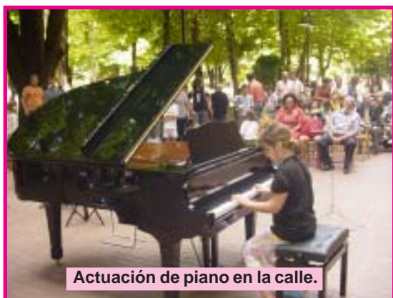
Actuación de piano en la calle.

Las dos reuniones de piano que tuvieron lugar en la Escuela entre Noviembre y Diciembre han sido una experiencia positiva. Les llamamos reuniones porque no asistió público fuera de los propios alumnos; la idea era hacer una audición (música interpretada por alumnos) que también sirviera para hablar, intercambiar información entre estudiantes y profesores en un ambiente de camaradería. Escuchar las interpretaciones de los propios compañeros es un ejercicio de concentración y ofrece la posibilidad de compartir un esfuerzo común. De esta manera, los niños son conscientes de que sus experiencias a la hora de practicar las piezas para piano no son únicas, las pueden comparar con las de los demás y sentirse integrados en un grupo.