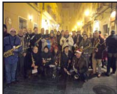
Con marcha por el Casco Antiguo.

Villancicos por el Casco Antiguo de Logroño... Los chicos y chicas de Bandaluse y Guindi-Jazz animaron las calles San Juan y Laurel la tarde-noche del 28 de diciembre con música a ritmo de swing, que sirvió además para «caldear» ese día tan frío.