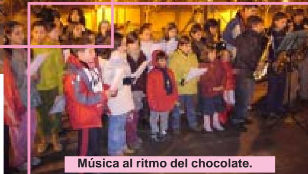
Música al ritmo del chocolate.

Deseamos que el 2006 haya sido un buen año para todos, y que el 2007 sea mucho mejor. ¡Feliz año nuevo!