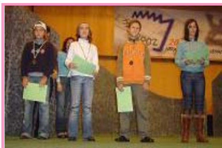
Algunos momentos en Mondragón.