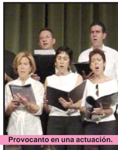
Provocanto en una actuación.

Desde estas líneas os invitamos a todos a disfrutar de las voces de Provocanto.