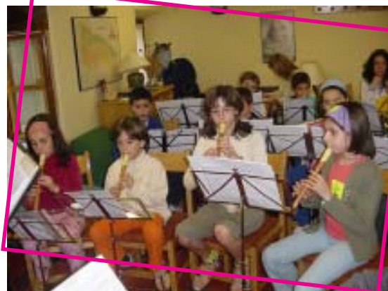
Flautas en Clase Colectiva.

Os invitamos a asistir a este concierto con vuestros hijos que seguro lo vais a disfrutar.