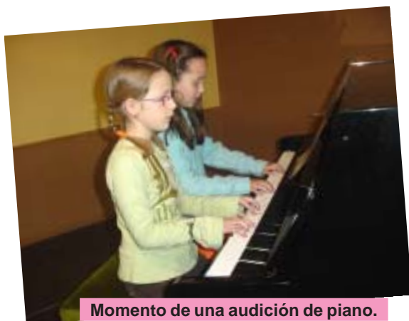
Momento de una audición de piano.

Los días 24 de noviembre y 1 de diciembre los alumnos de Piano de Pícolo y Saxo se reúnen sin público para compartir sus estudios, logros, preocupaciones, etc. En esta reunión de Piano se trata de tocar piezas elegidas por los propios alumnos, sin la tensión de la presencia del público y con el objetivo de mostrar a los demás pianistas el trabajo hecho hasta ahora.