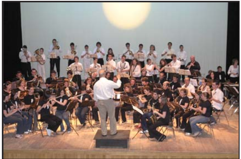
Pícolo y Saxo en Dax (Francia).

Durante estos tres días vamos a compartir experiencias, conocer su forma de trabajar y vivir la música. Nosotros corresponderemos a su visita el 26, 27 y 28 de enero. Allí acudiremos con una orquesta mixta integrada por varias formaciones.