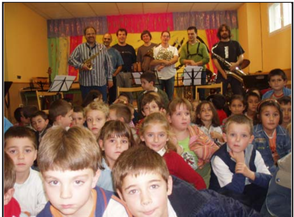
Alumnos de 7 infantes en la Escuela

Durante 1 hora conocieron varios instrumentos y escucharon canciones de ritmos y estilos diferentes. Por otra, y a continuación, los alumnos de 1º de primaria vinieron a visitar la Escuela. Fueron recibidos con música de Jazz y tras ofrecerles una pequeña charla sobre lo que iban a ver, se dividieron en grupos para entrar en las aulas donde les esperaban los músicos con sus instrumentos.