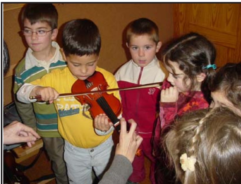
Taller de violín.

Lo podéis hacer incentivando y llevando un seguimiento de su evolución en valores como: responsabilidad (práctica diaria, cuidado del instrumento), valoración del esfuerzo (mejora de su capacidad instrumental), desarrollo de la sensibilidad, relaciones sociales (clase colectiva), valoración de la autoestima y de su actitud ante el público (audiciones)... así como cuidar la posición del cuerpo.