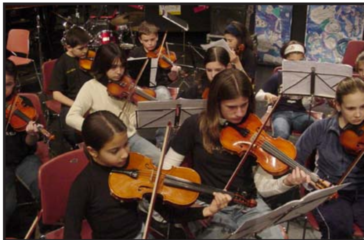
Orquesta Sinfónica en un concierto.