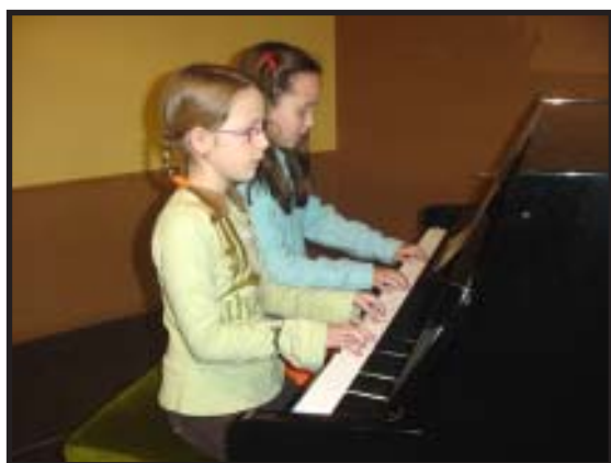
Alumnas de piano durante su audición.

En La Gacetilla de Mayo tendréis el programa completo de la Semana Cultural.