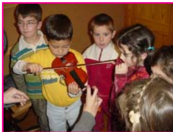
Grupo de niños/as en clase de violín.

Durante el mes de marzo, todos los alumnos/as de 3, 4 y 5 años han recorrido la Escuela para descubrir qué se hace en las distintas aulas, y los diversos instrumentos que se ofertan. En estos días los pequeños alumnos han sido los protagonistas. Han escuchado los instrumentos tocados por otros niños, los han visto, han conocido sus características, como se produce el sonido y en muchos casos los han tocado. A la hora de elegir instrumento a cada niño le influyen criterios diferentes; a unos la canción escuchada les hace sentirse identificados con el instrumento que la hacía sonar, a otros el músico que la interpretaba, a otros la forma, el timbre ... cualquier argumento es bueno a la hora de la elección.