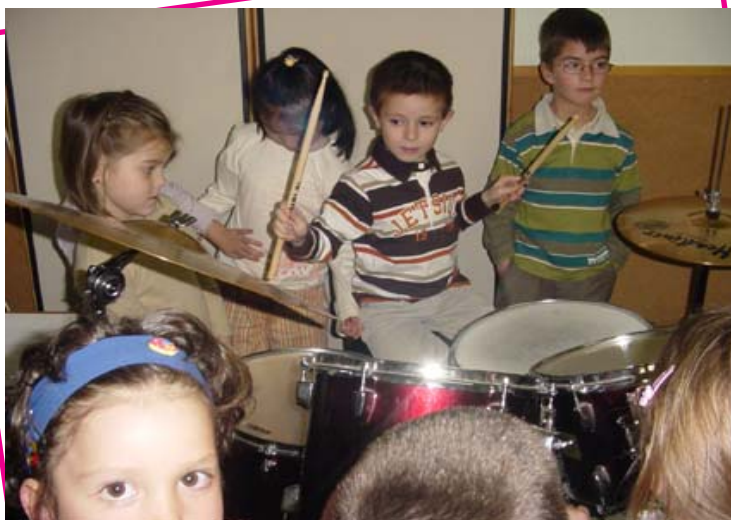
En clase de batería.

Pero las familias también tienen mucho que decir. Hay que valorar diferentes aspectos. La sonoridad , si queremos seguir manteniendo buena relación con los vecinos. No es lo mismo un saxofón que una mandolina. El tamaño ; no ocupa lo mismo una flauta que un piano. El precio ; no vale lo mismo un violín que un acordeón. Y cualquier otro criterio que surja.