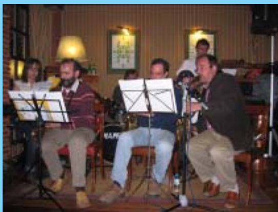
Combo Blues durante el concierto.

En el momento de cerrar esta edición recibimos información del concierto que ofreció el Combo Blues en el «Club de Jazz» Troika de Ezcaray el sábado 1 de abril. Un repertorio fresco y desenfadado animó los preámbulos del partido Barça-Madrid que no restó público al concierto. La experiencia ha resultado muy positiva y los “chicos” del combo están dispuestos a repetirla en breve.