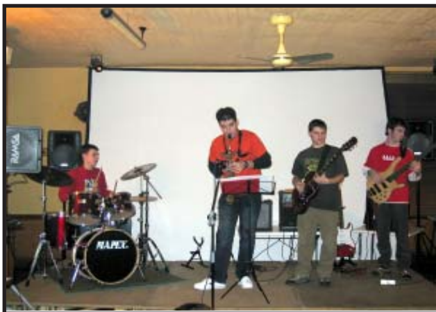
Nada al Respecto durante su actuación en Grávalos.