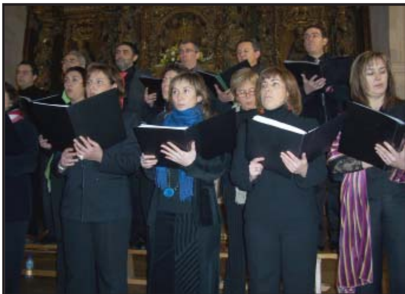
Provocanto en Grávalos.

EL CORO DE VOCES MIXTAS «PROVOCANTO», HA TENIDO UN FINAL E INICIO DE AÑO MUY INTENSO CON VARIAS ACTUACIONES POR LA RIOJA.