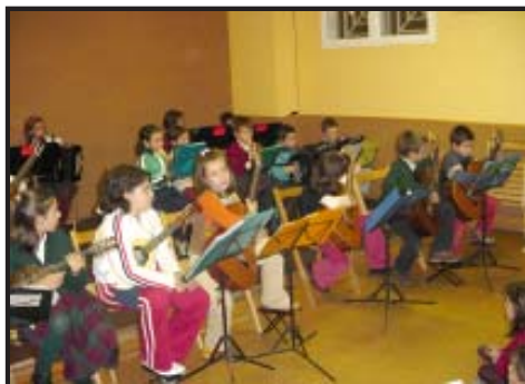
Orquesta y Colectiva de Plectro.

El Viernes 16 de Diciembre a las 8 de la tarde tuvo lugar en la Escuela la audición de alumnos de guitarra, Colectiva, Cámara y Orquesta de Plectro. Desde los más pequeños hasta los adultos nos ofrecieron un amplio repertorio de obras de diferentes estilos y temas navideños.