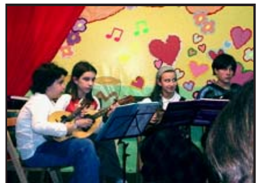
Orquesta de Plectro.

Como despedida la orquesta, junto a la colectiva, tocaron dos temas navideños: "La Marimorena" y "Navidad, Navidad".