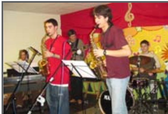
Combo Joven 2.