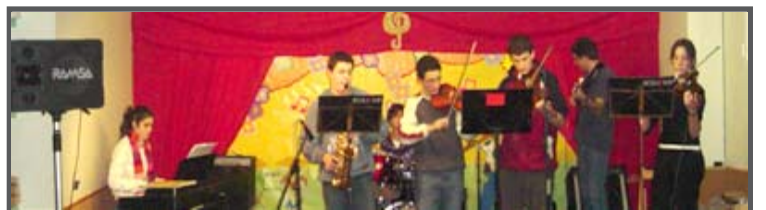
Combo Joven 1.