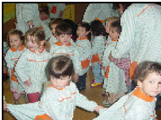
El baile de las estatuas.

Después de presentar la orquesta, se dividieron en grupos y en cada aula fueron recibidos por un profesor que les mostraba diferentes instrumentos e incluso hubo quien se atrevió a hacerlos sonar. Como despedida tuvimos una fiesta con danzas y juegos en la que todos participaron.