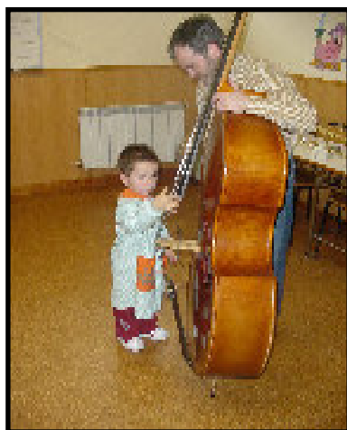
¡¡¡Cómo suena el contrabajo!!!

El pasado jueves 29 de abril visitaron la Escuela por segundo año consecutivo un grupo de 40 niños y niñas con edades comprendidas entre 2 y 3 años de la Guardería Petete de Logroño. Desde esta guardería se organizan diferentes salidas para que sus alumnos conozcan otras actividades que se desarrollan fuera de su entorno. Los pequeños y sus profesoras llegaron a la Escuela en autobús y fueron recibidos por una orquesta integrada por ocho músicos que iban a ser sus guías durante la visita.