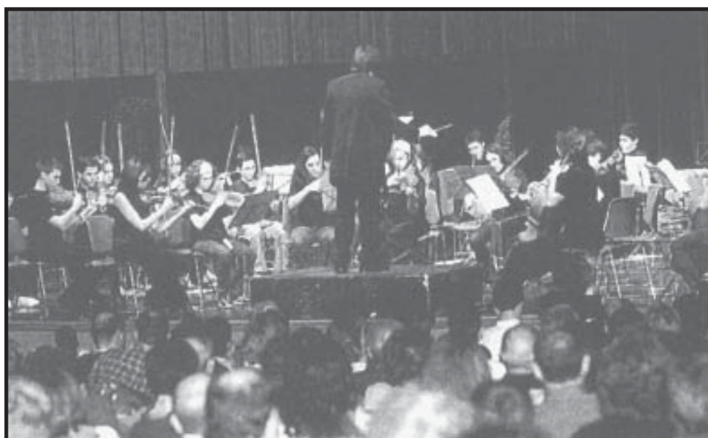
Actuación de la Orquesta Sinfónica Juvenil Pícolo en el Auditorium de Logroño 3 de enero de 2004.

durante el primer trimestre estuvo preparando varias obras comunes a las dos formaciones. Esto es un paso previo a la integración progresiva en la orquesta de los más jóvenes instrumentistas de cuerda.