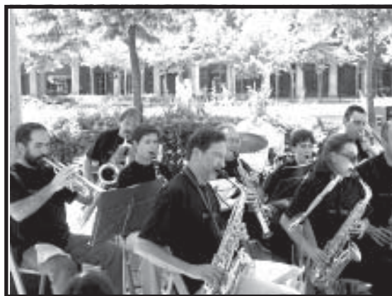
Actuación de Bandaluse en la Fiesta de la Música. Junio 2003.

En la actualidad la banda está formada por 23 músicos entre los que hay instrumentos de viento de todo tipo, (clarinetes, flautas, saxos, trompetas, trombones) con acompañamiento esporádico de sección rítmica. Ofrece conciertos y pasacalles, tanto por La Rioja, como por provincias limítrofes y ha participado en carnavales, navidades, fiestas de San Bernabé y San Mateo, conciertos didácticos, Fiesta de la música, etc, contabilizando más de 50 actuaciones desde que comenzó su andadura.