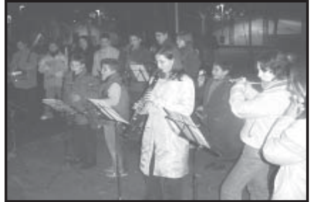
Banda Joven tocando villancicos durante la Fiesta del 22 de Diciembre.

Se repartieron cerca de 50 litros de chocolate y 6 kilos de bizcochos. Pasando por la plaza más de 200 personas que disfrutaron con el chocolate y la música.